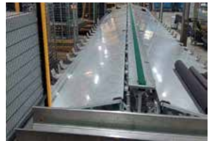
Gemeinsam entwickelten die Wäscherei Mireille und der Logistikspezialist WSP Systems eine Sortieranlage.

Die Verknüpfung des RFID-Chips mit dem ERP-System der Wäscherei soll folgen. Danach lässt sich laut WSP Systems alles im Chip abspeichern, z.B. die Größe, Farbe und Sorte der Matte – aber auch, wie oft die Matte gewaschen wurde. Die Steuerung könne dann gemäß diesen Parametern angepasst werden. „Natürlich kann man mit RFID automatisch sortieren, was schon sehr praktisch ist“,