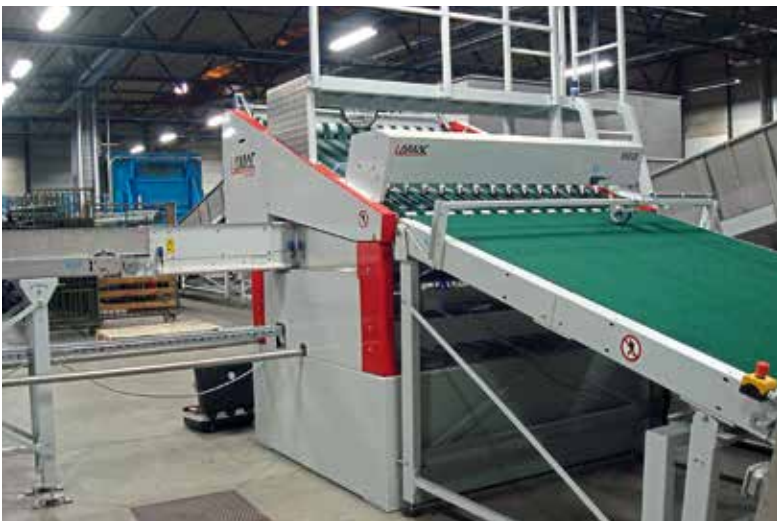
Um die Verarbeitungskapazität zu verbessern, entschied Mireille sich für die Mattenaufrollmaschine „Lamac RM18“ von Lamac Machinery.

Entwicklungen in der Wäscherei gibt es insbesondere dann, wenn Parteien aus dem Markt ihre Kräfte bündeln. Als die belgische Wäscherei Mireille mit dem Maschinenhersteller Lamac Machinery und dem Spezialisten für Systemintegration WSP Systems zusammenarbeitete, entstand so eine neue Technologie im Bereich Steuerung und RFID für das optimierte Waschen von Matten.